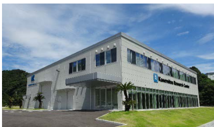
リサーチセンター外観

また現在、リサーチセンターでは、独自のバーチャル試作開発 KAVS (Kanemitsu Analyze Virtual Simulation) による設計ソフトを運用しています。今後、先行開発室は、この KAVS を活用し次代商品開発を強力に進めていく計画です。