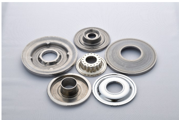
当社トランスミッション部品 製品群